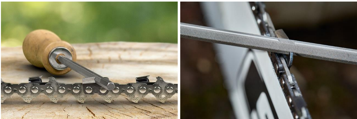
STIHL_Rapid_Hexa_Nachfeilen_1 / _2

Der Schneidezahn der neuen STIHL 3/8“ Rapid Hexa-Sägekette und die Form der 6-Kant-Schärffeile sind perfekt aufeinander abgestimmt. Im Vergleich zu Rundfeilen ermöglicht das STIHL Hexa-Schneidsystem – eine Weltneuheit – somit auch weniger geübten Anwendern das einfache Kettenschärfen im idealen Schräfwinkel.